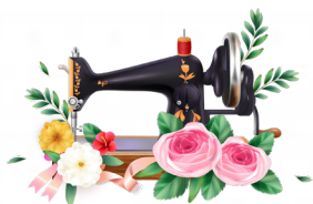
«Фетрошитье» «Мягкая игрушка»