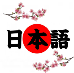
«Японский с нуля»