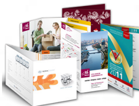
«Современный дизайн рекламы и печатной продукции»