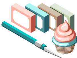
«Креатив декор: полимерная глина»